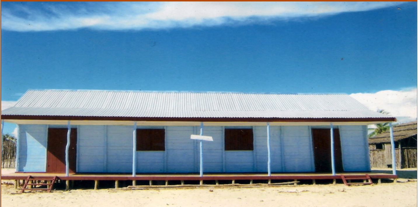
Nouvelle école du village d'Andrahangy

Association Belgique-Madagascar ASBL Fikambanana Belgika-Madagasikara ONG